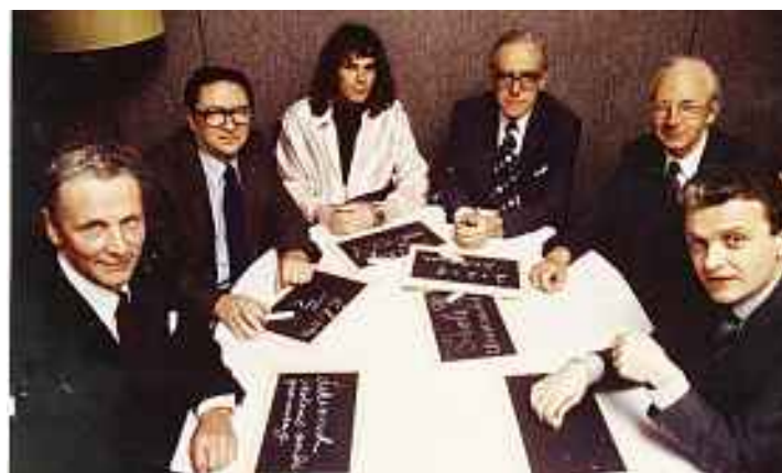
Tøff i rosa: Christian Vennerød diskuterte norsk skolepolitikk med landets elite i 1980. Rundt bordet sitter også daværende utdanningsminister Einar Førde, og tidligere finansminister Per Kleppe.